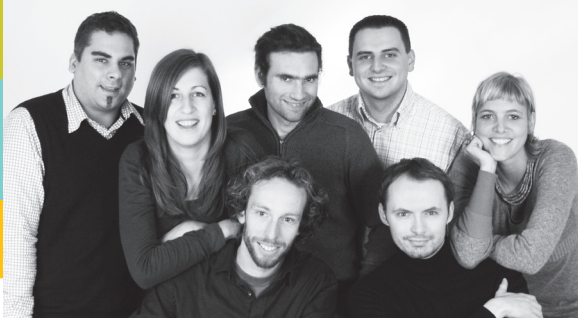
pro familia SexnSurf-Team